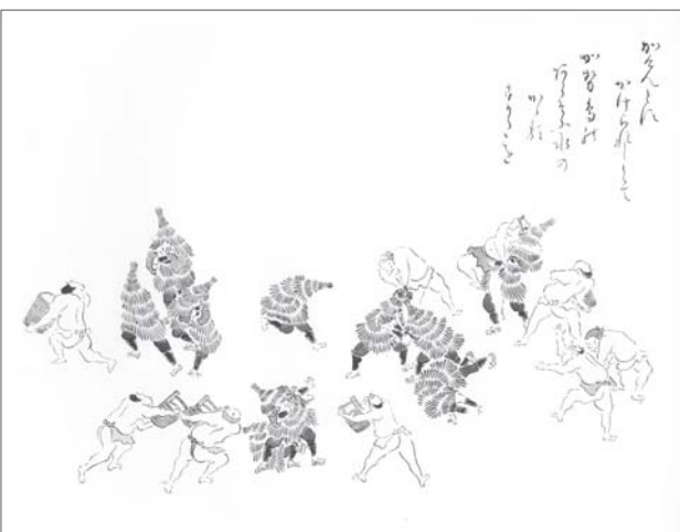
「上山見聞随筆」図付集（上市市教育委員会発行）

セ鳥を披露。御殿では新しい手桶と柄杓でカセ鳥に水をかけ、酒と銭一貫文でねぎらいました。一方の町方カセは、十五日、周辺部の各村から集まった若衆が、商家の連なる町中の門々を歩き回り、出迎える町の若衆は裸になって手桶の水を争うようにかけ、町人たちは火伏せや商売繁盛を祈願してご祝儀を出し、酒や切り餅を振る舞いました。